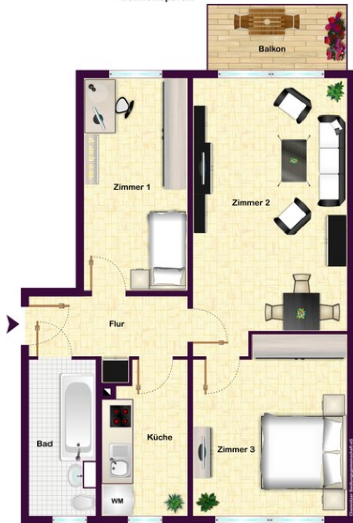
3-Raum-Wohnung rechts, Typ Q6