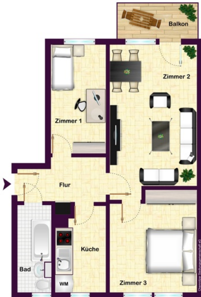
3-Raum-Wohnung rechts mit breitem Flur, Typ Q6